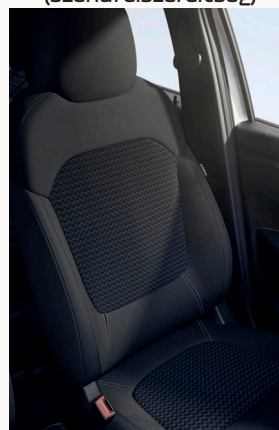
Szürke / szürke mintás textilkárpitozás szürke varrásokkal