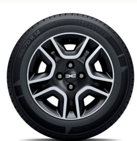
14" acél keréktárcsa DORIA dísz tárcsa (FlexWheel®) - fekete (fehér logo)