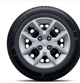
14" acél keréktárcsa BALBOA dísz tárcsa - ezüst