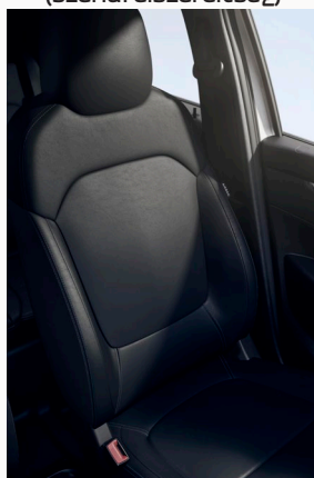
Fekete bőrhatású (TEP) kárpitozás szürke varrásokkal